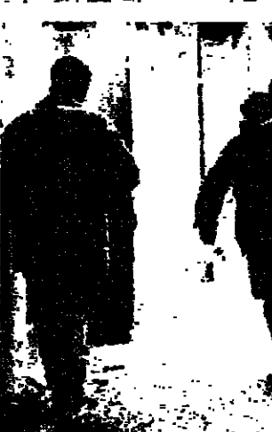
محاولات جادة لاستكشاف لغة الدفاع